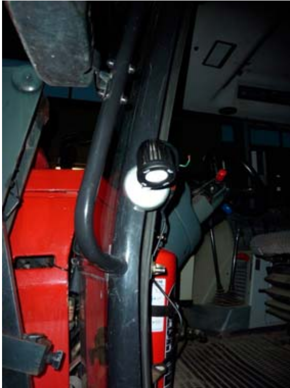
Figur 17. Bilden visar LED-armaturens placering intill dörren med hjälp av magnetfoten.