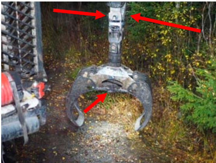
Figur 5. Pilarna markerar placeringen av de extra armaturer som monterades ute vid gripen.

På skotaren monterades två armaturer (900 lumen spridningsvinkel 40 grader) längst ut på utskjutets ovan- och undersida för att belysa området bortom och hitom gripen. Två armaturer monterade inuti gripen riktade rakt nedåt (500 lumen, spridningsvinkel 60 grader).