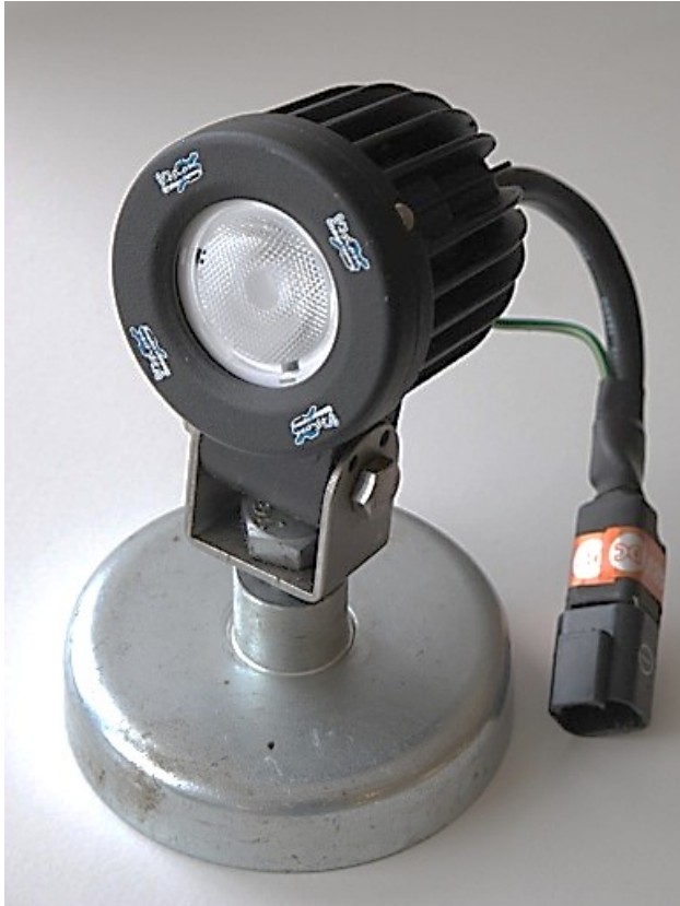
Figur 1. LED-lampa på magnetisk fot. IP68 klassning medger placering i påfrestande, tuffa miljöer.

Där lyckade tillämpningar identifierades dokumenterades placeringen av armaturerna och det gjordes en bedömning av vilken nytta det skulle innebära.