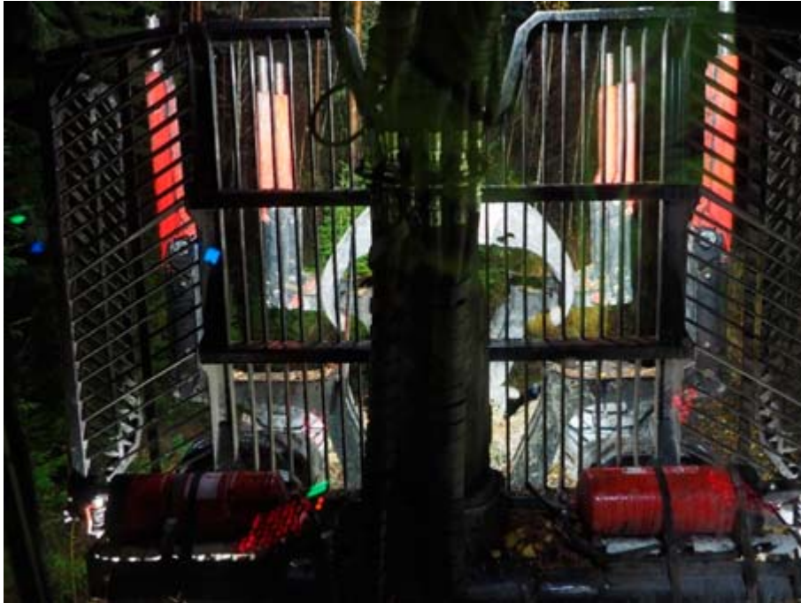
Figur 11. Armaturena på hyttaket är övertäckta och lastutrymmet belyses med armaturena på kranen.

När belysningen kompletterades med ett par svagare lampor monterade på hyttaket (Figur 12) som gav en grundbelysning av grinden upplevdes ljussituationen som mycket behaglig. Det gick utan problem att se lastutrymmet genom grinden samtidigt som föraren fick en bra uppfattning av grindens utbredning (Figur 12).