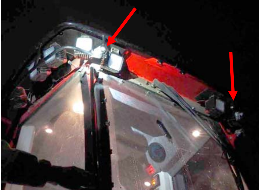
Figur 13. Pilen markerar de kompletterande mindre (500 lumen) armaturer vars syfte var att ge en grundbelysning av grinden och att belysa ändarna av stockar som hanteras i gripen.