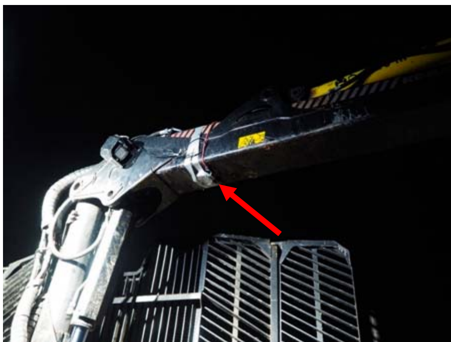
Figur 10. Pilen markerar den extra armatur (1 700 lumen) med bred ljusbild som monterades på undersidan av kranen.

Med lamporna på taket helt övertäckta och en extra armatur på huvudarmen (Figur 10) blev effekten som på Figur 11. Lastutrymmet framträder tydligare men kontrasten till grinden och kranpelaren blev skarp och de uppfattades som nästan helt svarta.