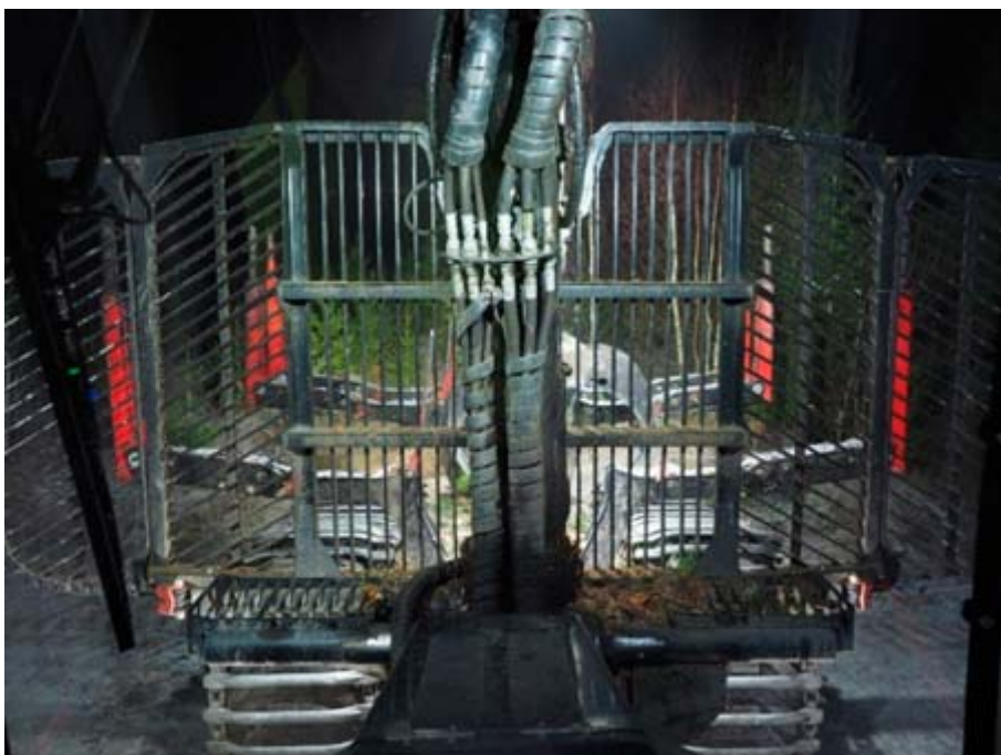
Figur 12. Belysningen i Figur 11 kompletterades med två svaga lampor monterade i hörnen på hyttaket.

När belysningen kompletterades med ett par svagare lampor monterade på hyttaket (Figur 12) som gav en grundbelysning av grinden upplevdes ljussituationen som mycket behaglig. Det gick utan problem att se lastutrymmet genom grinden samtidigt som föraren fick en bra uppfattning av grindens utbredning (Figur 12).