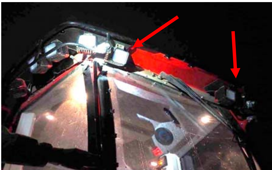
Figur 7. Pilarna markerar de ordinarie strålkastarna (3 000 lumen) som är riktade bakåt mot grinden och lastutrymmet.

För belysning av lastutrymmet har maskinen som ordinarie belysning två arbetsstrålkastare (3 000 lumen) med bred ljusbild monterade på hyttaket och är riktade rakt bakåt. Dessutom sitter en likadan strålkastare monterad på var sida av kranen, vid övergången mellan kranpelaren och huvudarmen, som belyser lastutrymmet när kranen har den riktningen (Figurerna 7, 8 och 9).