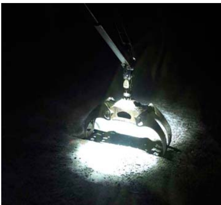
Figur 6. Bilden visar ljusbilden från armaturerna monterade på änden av utskjutet. Här är inte armaturena inne i gripen tända.