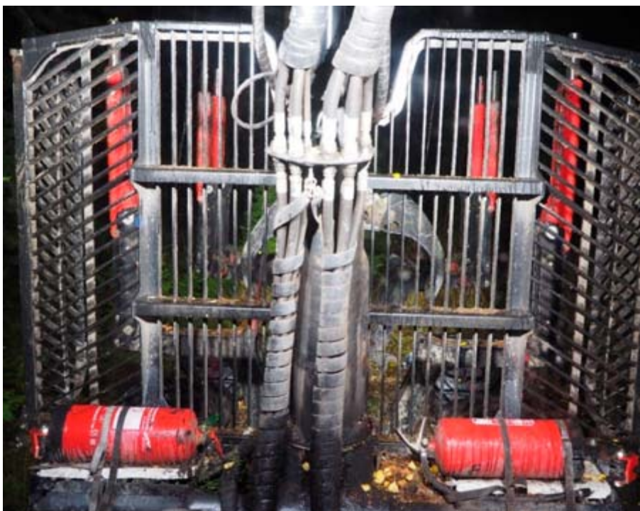
Figur 9. Standardbelysning över lastutrymmet.