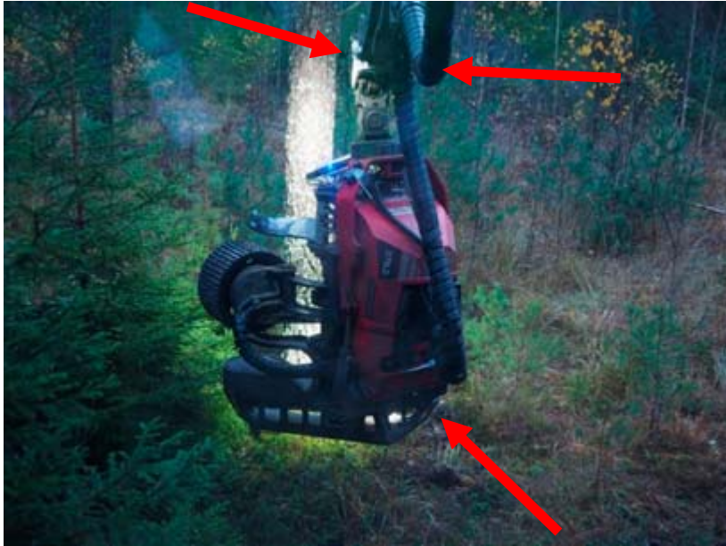
Figur 2. Endast armaturerna ute vid aggregatet är tända. Pilarna markerar placeringen av armaturerna.

Armaturernas syfte är att underlätta skogsmaskinförarens synprestation vid ansättning genom att ge extra belysning från aggregatet riktat mot och längs med det träd som aggregatet skall ansättas mot. En bred ljuskägla eftersträvas eftersom aggregatet ofta ansätts mot träd från sidan åt ena eller andra hållet. Målet är att ge bättre förutsättningar för ansättningen genom att trädet framträder bättre visuellt och är starkare belyst än aggregatet. Då blir det lättare att ”se förbi” aggregatet och genomföra ansättningen. I dagsläget är all belysning placerad antingen på hyttaket, längre upp på kranen eller på basmaskinen. Det leder till att aggregatet som befinner sig närmre armaturerna blir mer och starkare belyst än trädet. Aggregat är dessutom ofta delvis målade i ljus färg och en del delar är av blank metall medan träden oftast är mattare och mörkare. Det innebär att aggregatet kommer att reflektera mer ljus än träden, med risk för bländningseffekter.