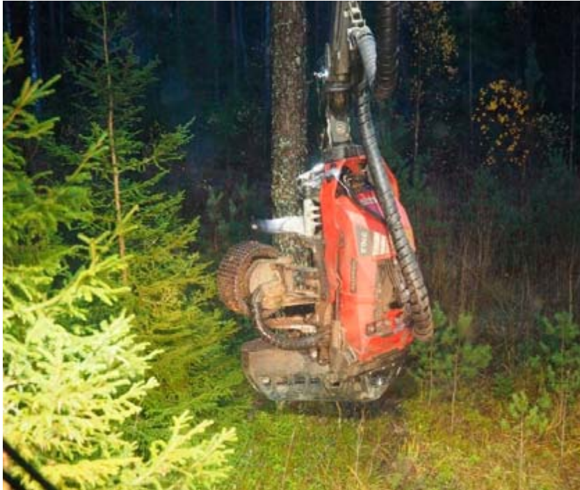
Figur 3. Endast maskinens ordinarie belysning är tänd.