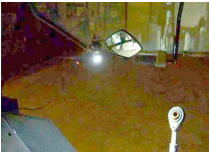
Figur 19. Bilderna visar hur föraren genom spegeln kan se den av LED-armaturen upplysta hitch-kroken.