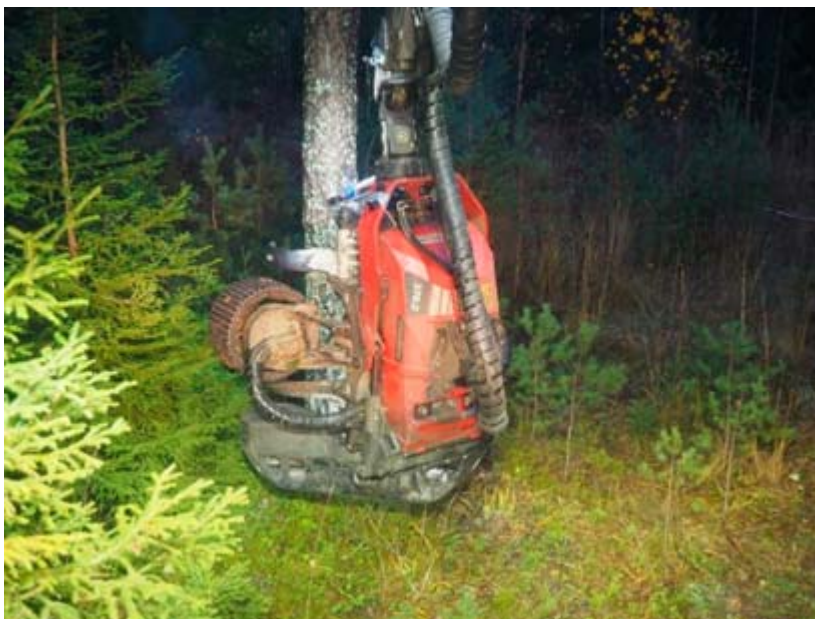
Figur 4. Maskinens ordinarie belysning och armaturerna vid aggregatet är tänd.

Med lamporna längst ut på utskjutet tända uppfattades stammen tydligare. Speciellt märks detta genom att stammen syns genom utrymmena mellan matarvalsarna och övriga delar på aggregatet.