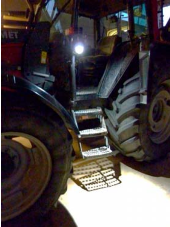
Figur 15. Fotografiet visar placering och resultat med LED-armaturen vid traktorstegen.