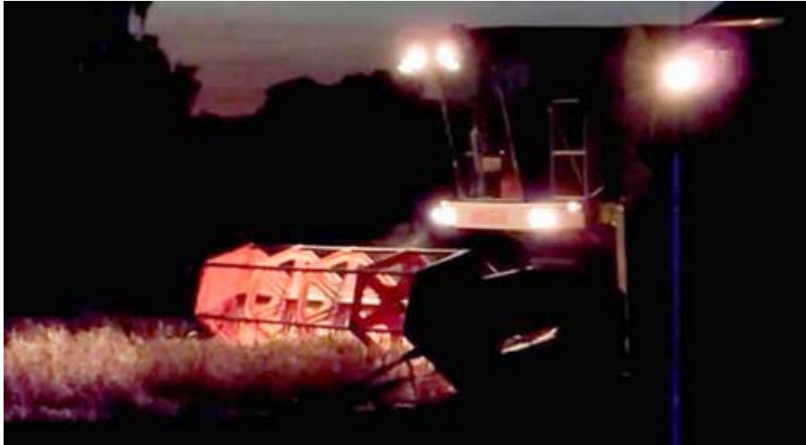
Figur 14. Ögonblicksbild ur en video med en tröska under skörd en augustikväll.