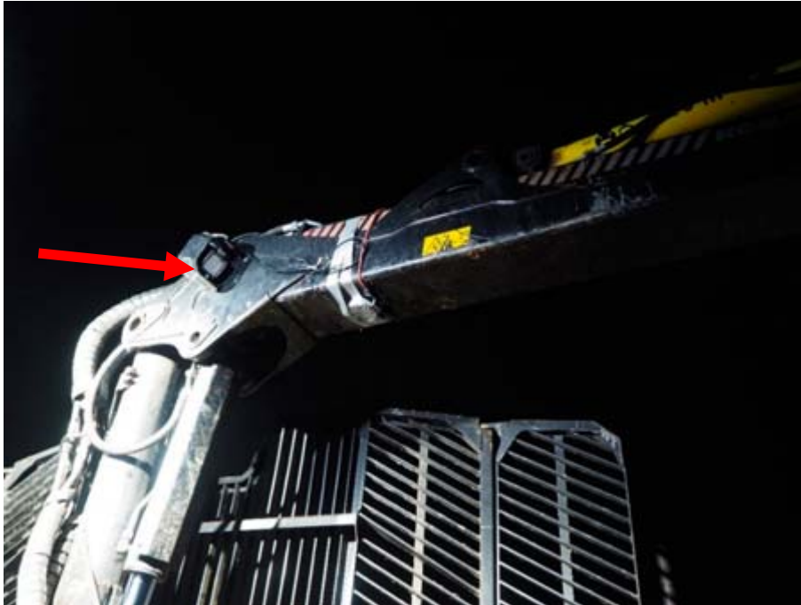
Figur 8. Pilen markerar den ena av de två ordinarie strålkastarna (3000 lumen) som är monterade på var sida av kranen.