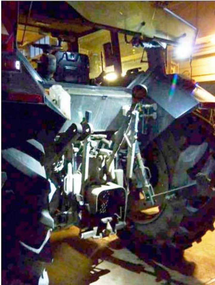
Figur 18. Fotografiet visar placeringen och belysningen av hitch-kroken från LED-armaturen.