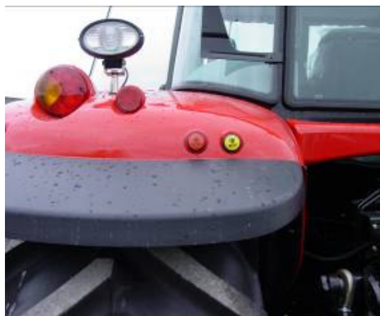
Bild 2. Utvändiga manöverreglage för traktorns kraftuttag