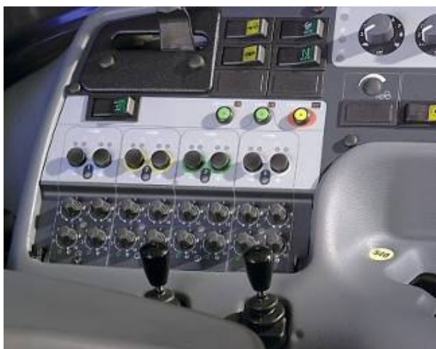
Bild 1 Manöverpanelen för yttre hydraulik i en moder traktor (Valtra t-serien).

På den här typen av system kan hydrauliken, joystick och kontrollpanelen enkelt deaktiveras, vilket ökar säkerheten betydligt.